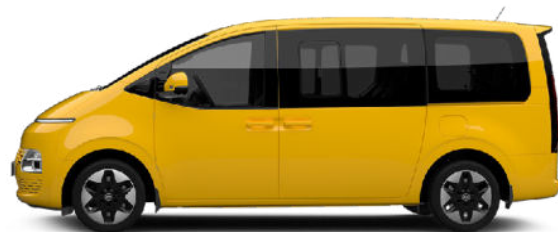
Dynamic Yellow nur für Kastenwagen verfügbar