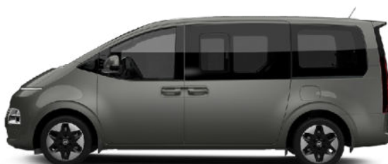
Cast Iron Brown Pearl nur für Prestige Line