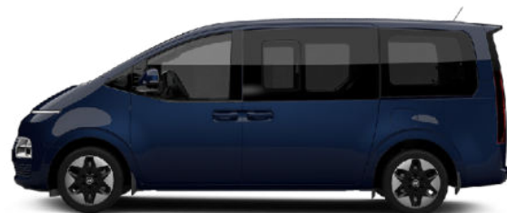
Classy Blue Pearl