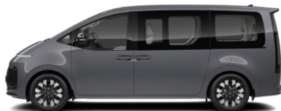
Ecotronic Gray Pearl