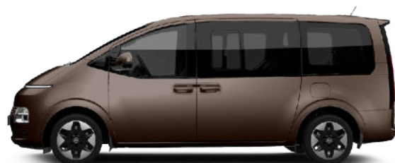
Galaxy Maroon Pearl nur für Prestige Line